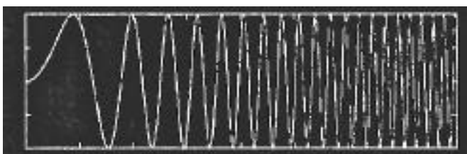
写真3 チャープ信号

正弦波発生器のアルゴリズムの応用として，下のようなチャープ信号の生成が考えられます。