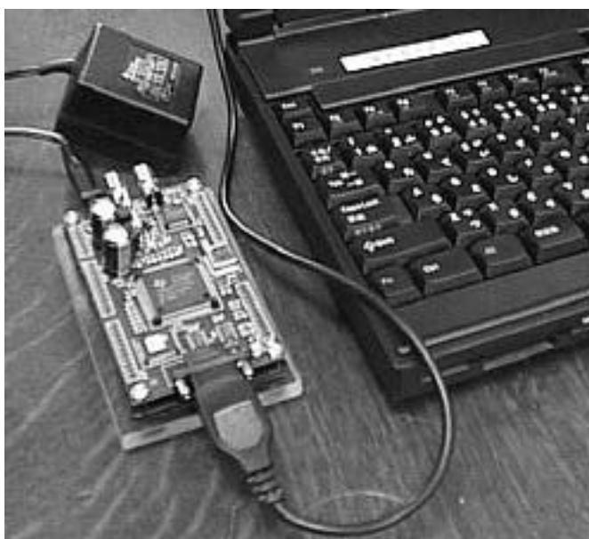
写真2 RS232Cケーブル（実はマウス延長 ケーブル）で Think Pad に接続